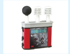
EQUIPO DE ESTRÉS TÉRMICO 3M QUESTEMP