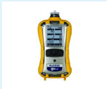
MONITOR DE GAS PORTÁTIL RAE SYSTEMS PGM-6208