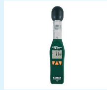
EQUIPO DE ESTRÉS TÉRMICO EXTECH INSTRUMENTS HT30