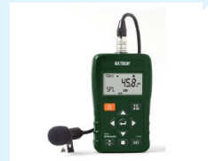
DOSÍMETRO EXTECH INSTRUMENTS SL400