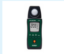
LUXÓMETRO EXTECH INSTRUMENTS LT40