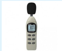
SONÓMETRO EXTECH INSTRUMENTS 407730