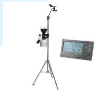
ESTACIÓN METEOROLÓGICA DAVIS INSTRUMENTS 6152C