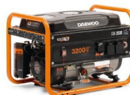
GENERADOR ELÉCTRICO DAEWOO GD3500