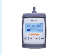
BOMBA DE MUESTREO PERSONAL CRIFFER MICRO