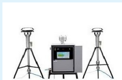
MUESTREADOR DE PARTÍCULAS INSTRUMEX IPM-FDS 2510 DUAL CHANNEL