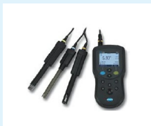
MULTIPARÁMETRO HACH HQ30D