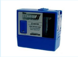
BOMBA DE MUESTREO PERSONAL GILIAN BDXII