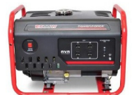
GENERADOR ELÉCTRICO POWER FORCE 168FB-2