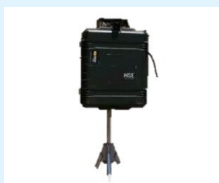
TREN DE GASES DWYER TMD O RMA-13